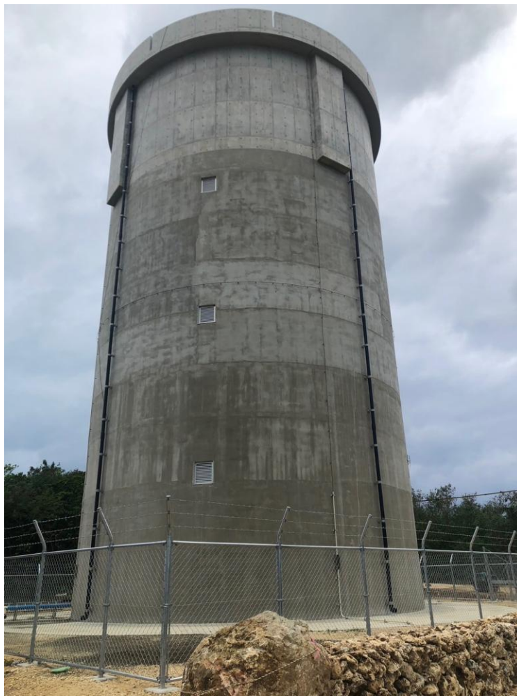
竹富新配水池(令和5年度竣工)