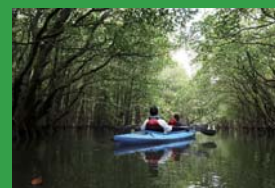
適正な観光管理の実現