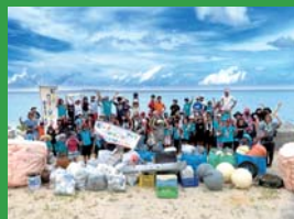
海岸漂着ゴミ対策