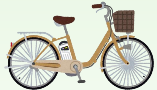
電動アシスト自転車 (バッテリー部のみ)