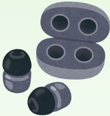
ワイヤレスイヤホン