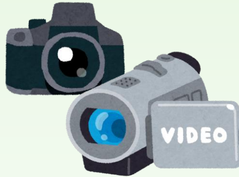
デジタルカメラ ビデオカメラ