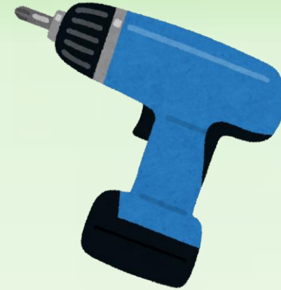
電動工具のバッテリー