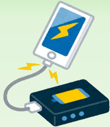
モバイルバッテリー