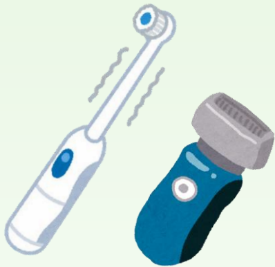
電動歯ブラシ 電気シェーバー