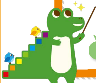
つみたてワニーサ