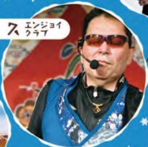
from 黒島 島仲 久 エンジョイ クラブ