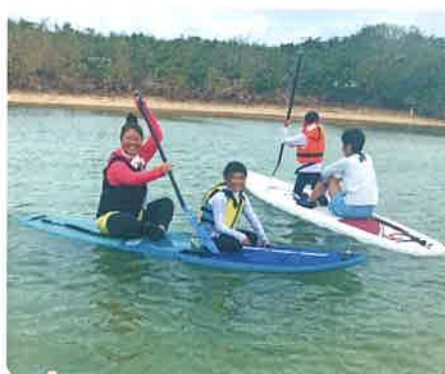
親子で楽しみました