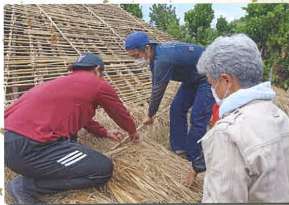
地域住民が協力しすべて手作業で