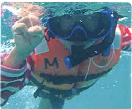
小学生はシュノーケリングを満喫