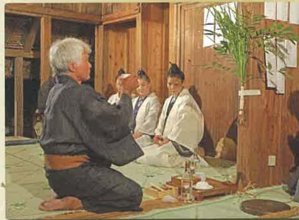
木の神「ユシトゥンガナシ」にニンガイ

完成に伴い、祖納公民館は、10月22日に落成祝賀会を開催しました。地域からも大勢の人が参加し、古謡「家タカヒ」「アパレー」を歌い盛大にお祝いしました。