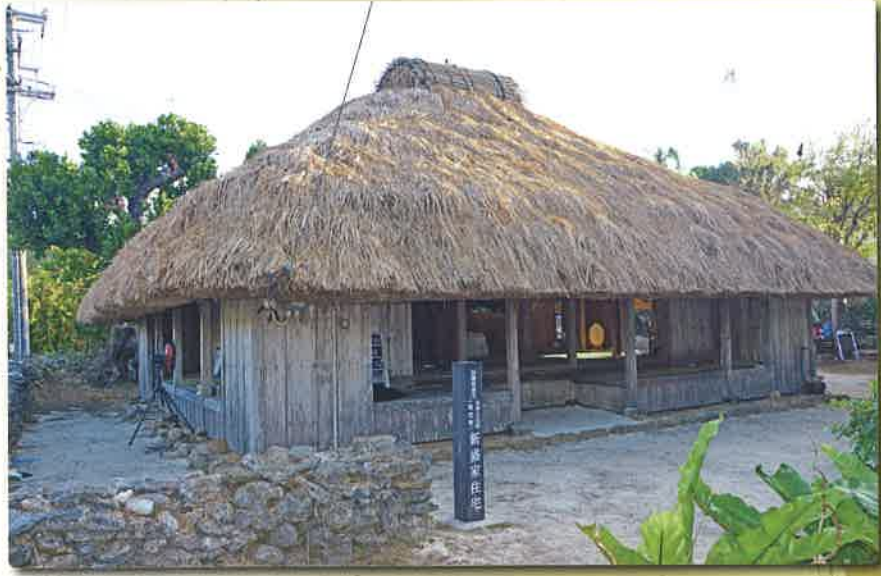
萱を葺き替えた新盛家住宅