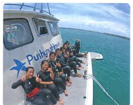
中学生はダイビングを体験!