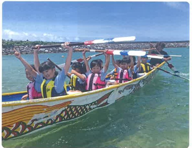
ハーリーに参加しました

小浜小中学校では、これまでに、もずく採りやハーリー、シュノーケリング・ダイビング体験など、学校行事だけではなく、地域の行事にも参加することで海についての知識や親しみを深めています。