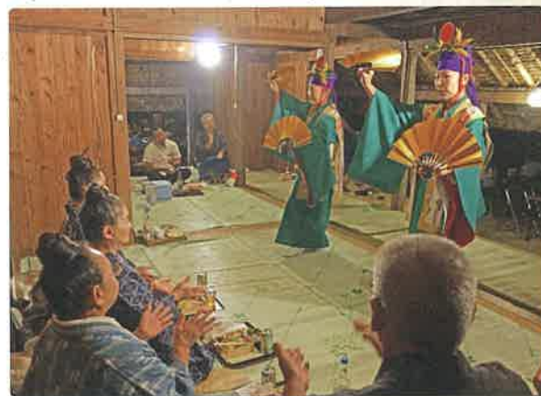
さまざまな舞踊も披露されました