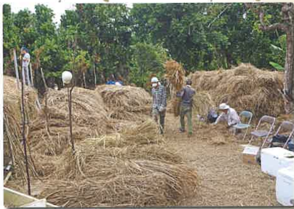
準備された大量の萱