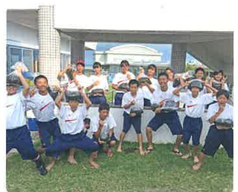
もずくをたくさん採りました!