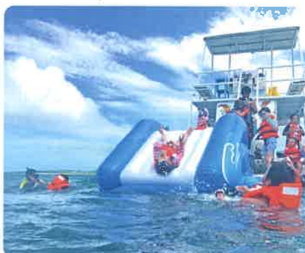
すっかり海に慣れて、背面からダイブ!