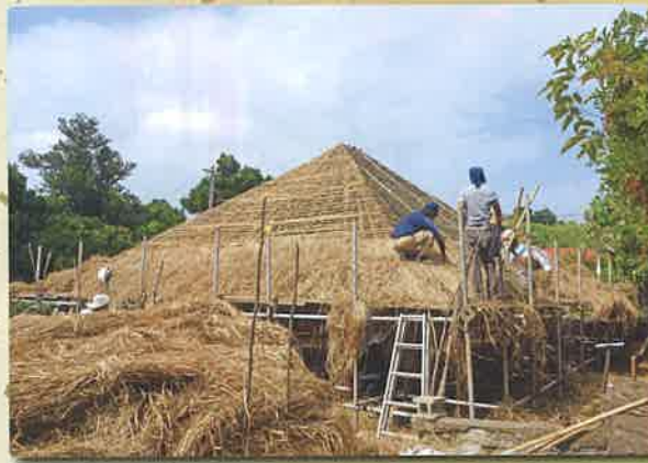
下から順に葺いていきます