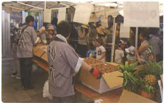
↑パインとマンゴー目当てに長蛇の列