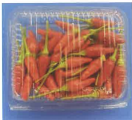
シマトウガラシ生果実