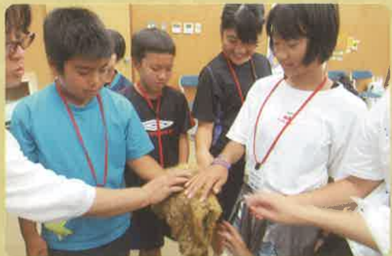
→ 貴重なツシマヤママネコの毛皮も触りました。