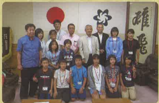
→ 対馬市役所にて比田勝市長らと記念撮影