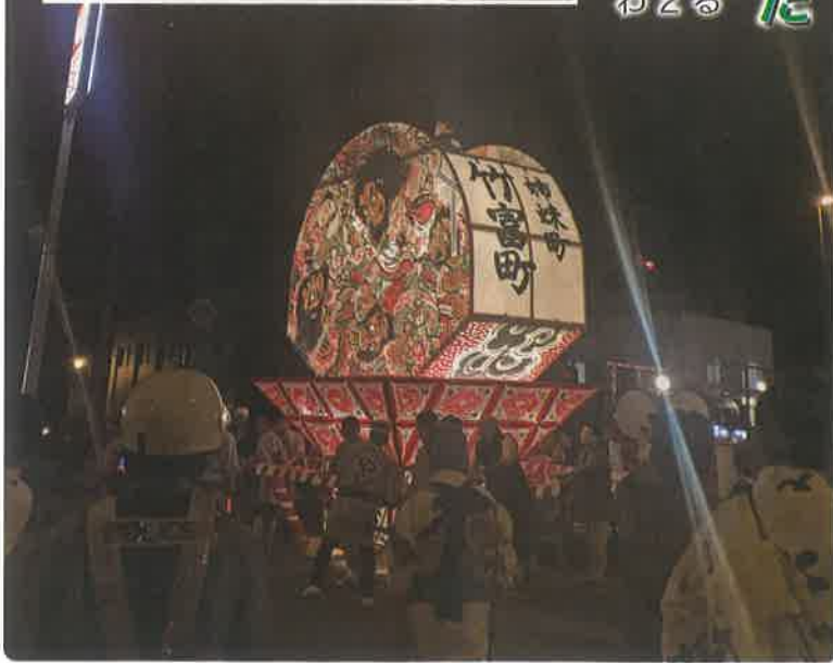
↑姉妹町竹富町の文字が書かれた扇ねぶた