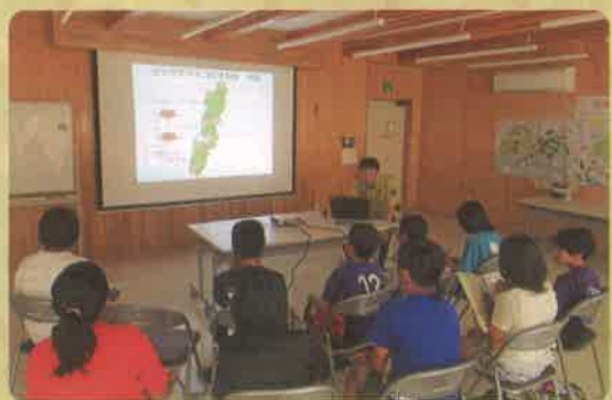
→ しっかり勉強もしました！