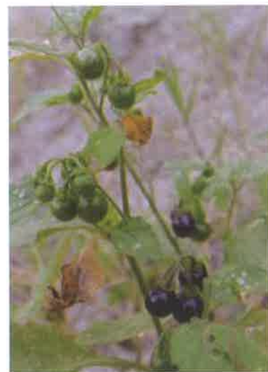
【テリミノイヌホオズキ】