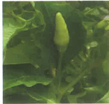
※未熟果も含みます