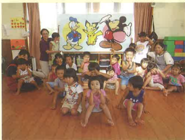
↑寄贈を喜ぶ小浜保育所の子どもたち

竹富町社会福祉協議会から、竹富町制施行70周年の記念として、地域との交流を図るべく絵画の寄贈がありました。町内各保育所に贈られ、子どもたちは笑顔で喜びました。