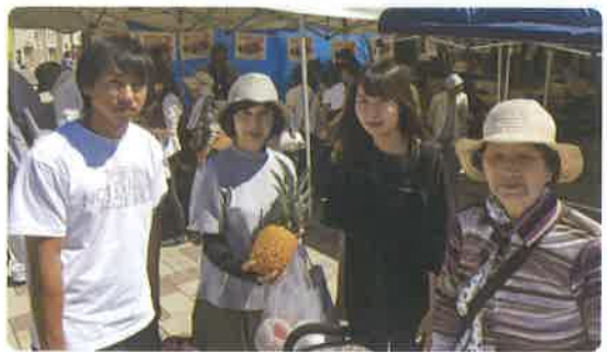
↑朝9時30分から並んでパインとマンゴーを購入した斜里町在住の御一家