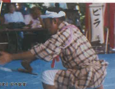
「宮城」巻き踊り(節祭)