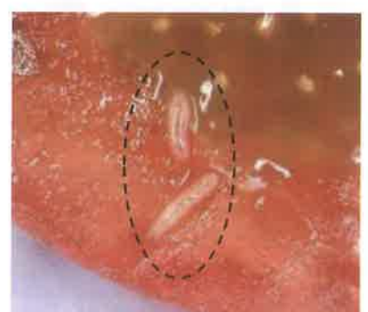
写真5 トマトの被害 （円内は幼虫）

沖縄県病害虫防除技術センター Tel：098-886-3880 八重山駐在 Tel：0980-82-4933 沖縄県八重山農林水産振興センター スタッフ Tel：0980-82-3043 与那国町産業振興課 Tel:0980-87-3582 沖縄県八重山農林水産振興センター 農業改良普及課 Tel：0980-82-3497 与那国駐在 Tel：0980-87-2354