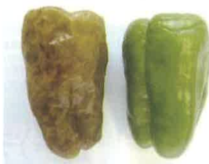
写真4 ピーマンの被害（左）