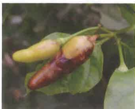
写真3 シマトウガラシの被害