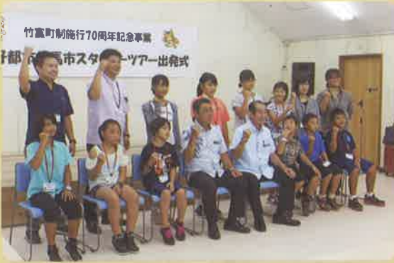
→ 出発式にて「行ってきまーす」