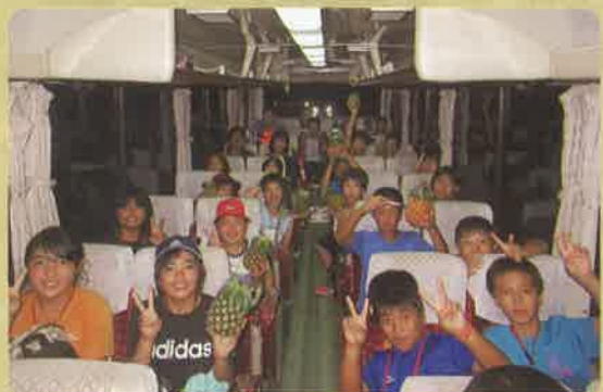
→ 佐須奈小学校児童との交流