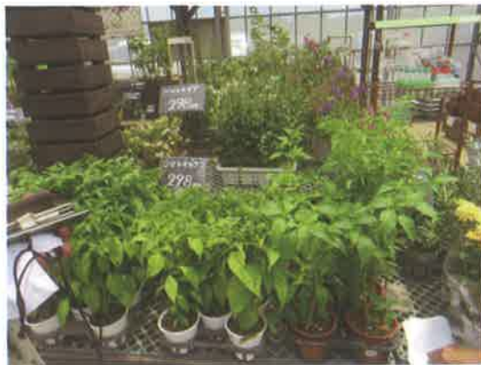
果実のついたシマトウガラシ苗