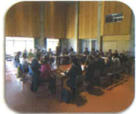
昨年度の西表島部会の様子

※傍聴可能（無料）、事前の申込み手続き等は不要です。 当日会場にお越しください。