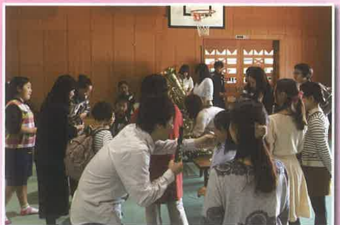
↑楽器の演奏体験の様子