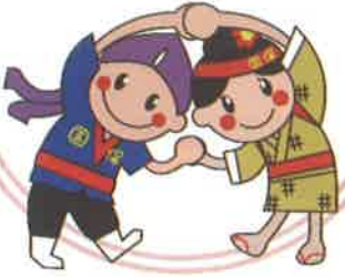
けんこうくん おんしんちゃん 沖縄県 国保マスコットキャラクター