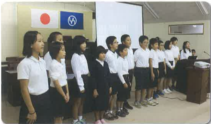
↑大原小学校児童 15 名による発表の様子

町長提言の発表では、自然環境保全に向けたロボット開発や、水中動物を近くで見ることができるとンネル、セマルハコガメをモチーフにしたクッキーなど、独創性あふれるアイデアが次々と発表されました。