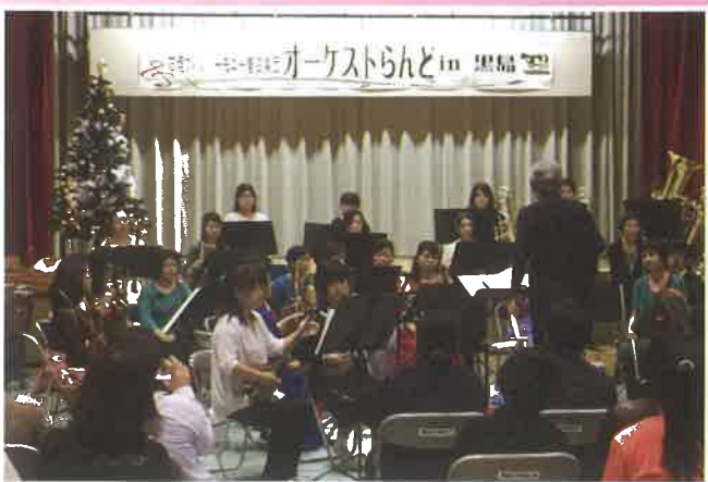
↑三線とオーケストラの共演