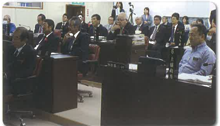
↑提言に耳を傾ける町議員、町職員