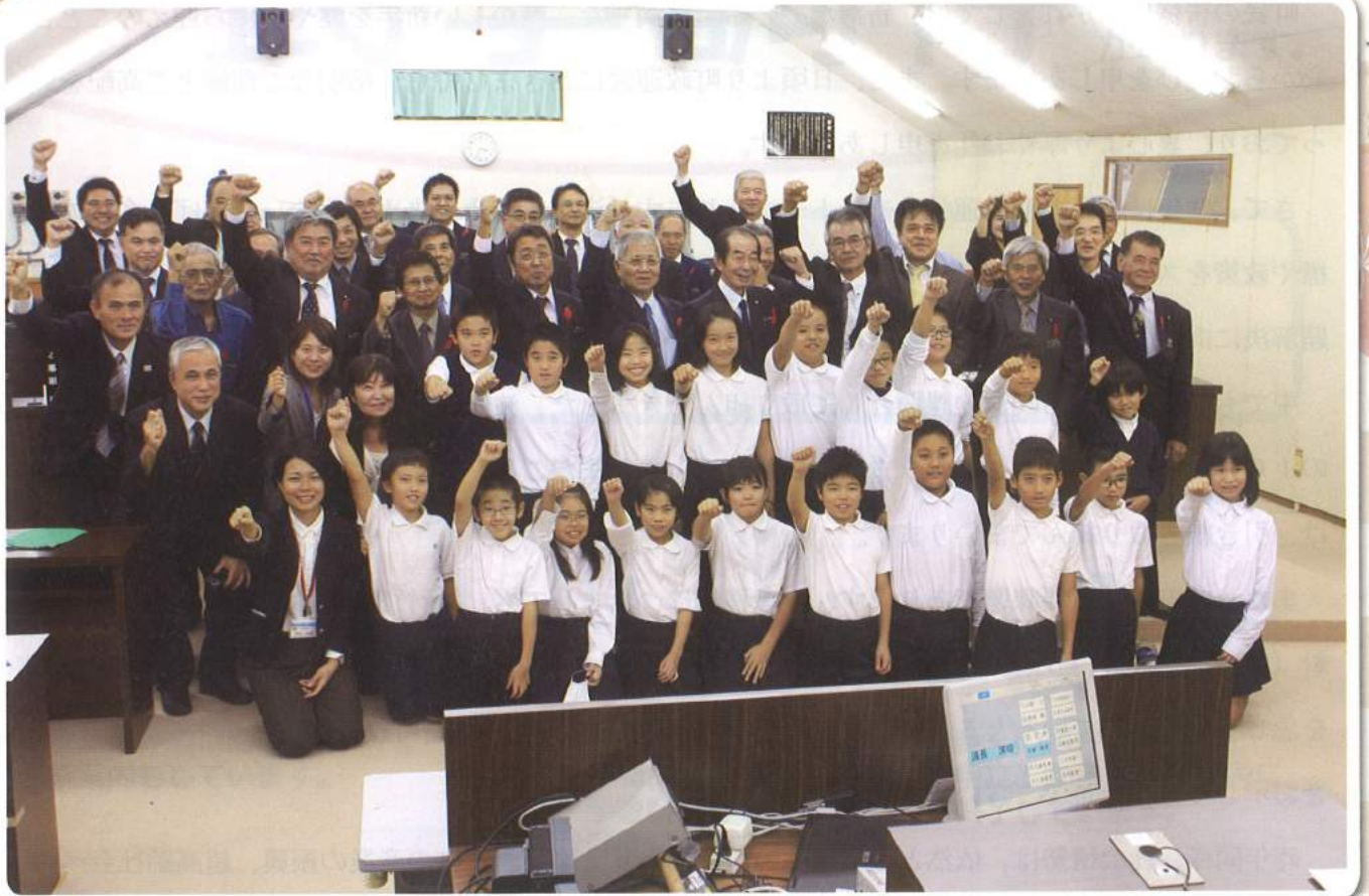
町長に提言発表後の集合写真