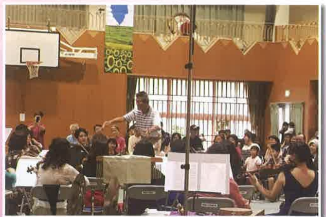
↑指揮者体験の様子