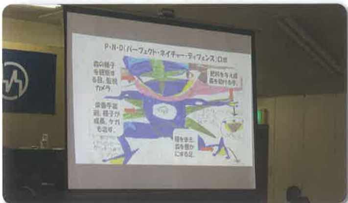
↑P・N・D（パーフェクト・ネイチャー・ディフェンス）ロボ