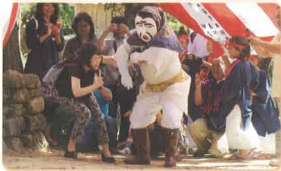
→会場へ誘うオホホ