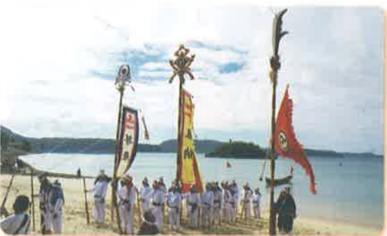
→フニクイ(舟漕ぎ)整列した舟子