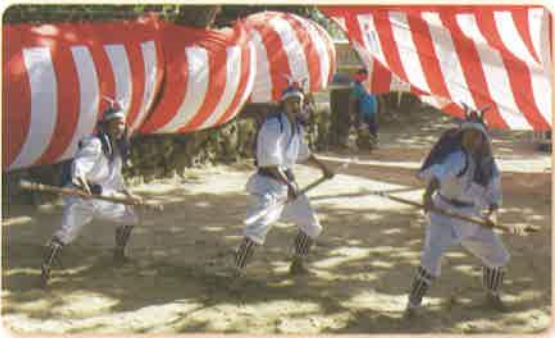
→棒術を披露する子供達