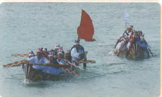
→フニクイ(舟漕ぎ)競漕