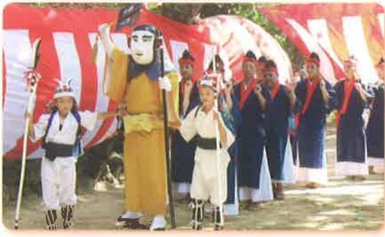
→ミリックの行列ミヤ(広場)巡回