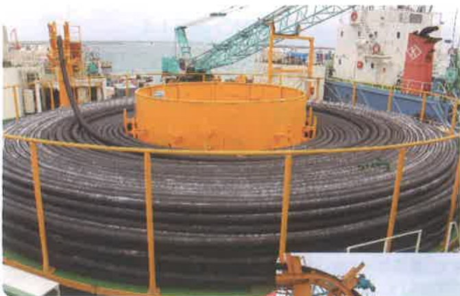
↑ターンテーブルに巻かれる 海底送水管総延長約7km

竹富町水道課において、竹富町東部第1区海底送水管更新事業(新城島・黒島)を実施しており、φ150の特殊ポリエチレン管を約7km区間において更新する予定です。 11月24日、南ぬ浜町の護岸に停泊していた特殊台船(あわじ)の見学会がありました。「あわじ」は自動船位保持装(DPS装置)を4箇所搭載しており、アンカー打設が不要となり、サンゴ礁などの海底生物を傷付けることなく早期な施工が可能です。 今後、長期予報により、天気・風速・潮位等が最適になるのに合わせて、海底送水管の更新を進める予定です。