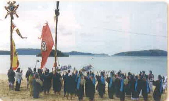
→フニクイ(舟漕ぎ)ガリー