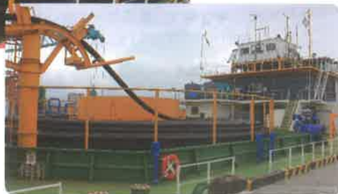
特殊布設台船(あわじ) →