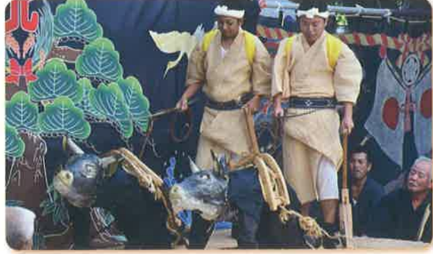
↑ウロンツンヌジラン