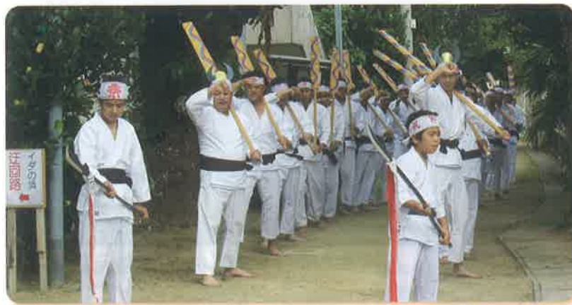
↑ヤフヌテイを披露する舟子たち

11月9日、船浮カマドマ広場にて、船浮集落の伝統行事である節祭(シチイ)が開催され地域住民や郷友、観光客らと一年の豊作・豊漁と無病息災を祈願しました。午前十一時には「願い」の儀式が執り行われ、午後十二時から、奉納行事として舟漕ぎに舞踊や棒、獅子舞など多彩な演目が披露されました。