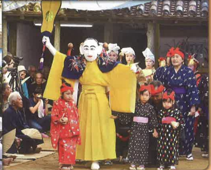
節祭(干立)、節祭(祖納)、結願祭(小浜)、節祭(船浮)