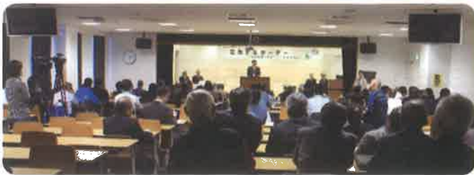
↑セミナー会場の様子