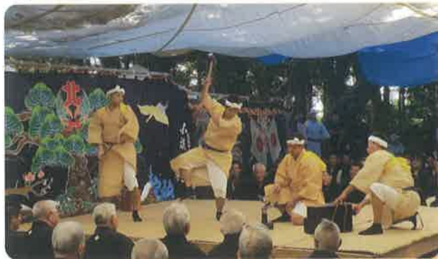
↑カンザクキョングイン (鍛冶工狂言)