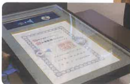
← 瑞宝双光章における賞状と勲章