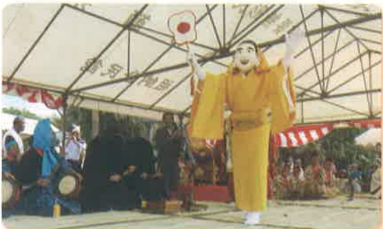
→ミリックの座舞い

国指定の重要無形民俗文化財で500年以上の伝統を誇る、西表島祖納の節祭(シチ)の世乞い(ユークイ)が、11月9日祖納集落で執り行われました。祖納公民館(千員代志人館長)では、前泊海岸でミリック行列やユナハ節・ヤーラーヨーの曲に合わせ、アンガー行列が厳かに入場し、船漕ぎでは、婦人らがドラの音に合わせてガリーで舟と「世」を迎えました。