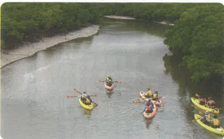
▲ 後良川調査の様子