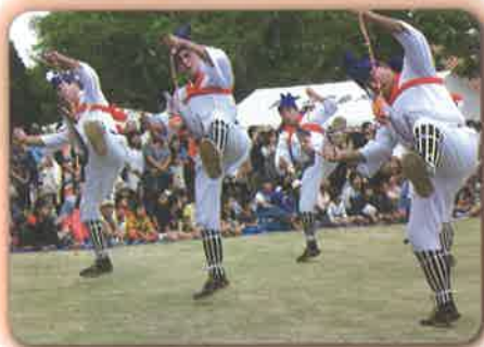
馬乗者（ンマヌシャ）

10月30日から31日にかけて、竹富島で最大の行事である、国指定重要無形民俗文化財の「種子取祭（タナドゥイ）」の奉納芸能が世持御嶽で執り行われました。 種子取祭は種を蒔き、農作物の豊穰を祈願する祭事で約600年の歴史を有するとされています。 初日は坂屋間村、2日目は仲筋村を中心として庭・舞台の芸能が奉納されました。 両日ともに会場には、県内外の郷友や観光客らが多く詰めかけ、伝統芸能を堪能しました。