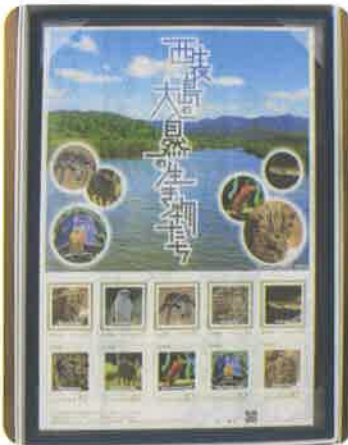
▲ オリジナルフレーム切手 「西表島の大自然の生き物たち」