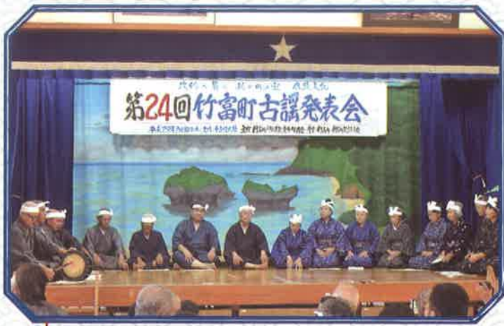
雨ぬ根〜引羽（雨乞い謡）／竹富民俗芸能保存会

舞台は、竹富民俗芸能保存会による「雨ぬ根〜引羽（雨乞い謡）」で幕明けし、次いで鳩間民俗芸能保存会の「サンマーレ」が披露されました。小浜民俗芸能保存会は家屋の新築落成の際に斉唱される「家ヨータカ」、「松金ユンタ」を、古見民俗芸能保存会の「缸ゆば節」では子供たちも参加し、古見村の前良川と後良川に初めて石積み橋を架けた経緯や工程を古謡で披露しました。西表民俗芸能保存会は、種子取祝（旧暦10月）に唄われる「米神酒ぬアヨ」を、新城民俗芸能保存会は、節祭で唄われる「きゆがびい」をそれぞれ披露しました。