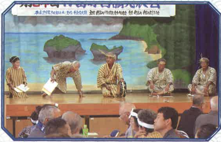
サンマーレ／鳩間民俗芸能保存会