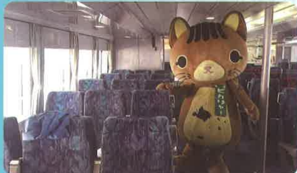
船内の様子とぴかりゃ