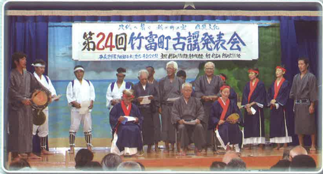
ササラン (千支民俗芸能保存会)