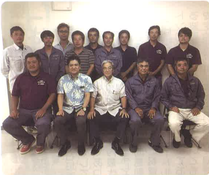
▲ 第15期 竹富町農業委員の皆さん

農業委員会は、農地法に基づく売買・貸借の許可、農地転用案件への意見具申、遊休農地の調査・指導等を中心に農地に関する事務を執行する行政委員会として市町村に設置されています。また、農業委員会等に関する法律が改正され、「農地等の利用の最適化の推進」を明確化し、農業委員の選出方法が、選挙制と市町村長の選任制の併用から「市町村長の任命制」に変更、「農地利用最適化推進員」の新設等が行われ、平成28年4月から施行されています。