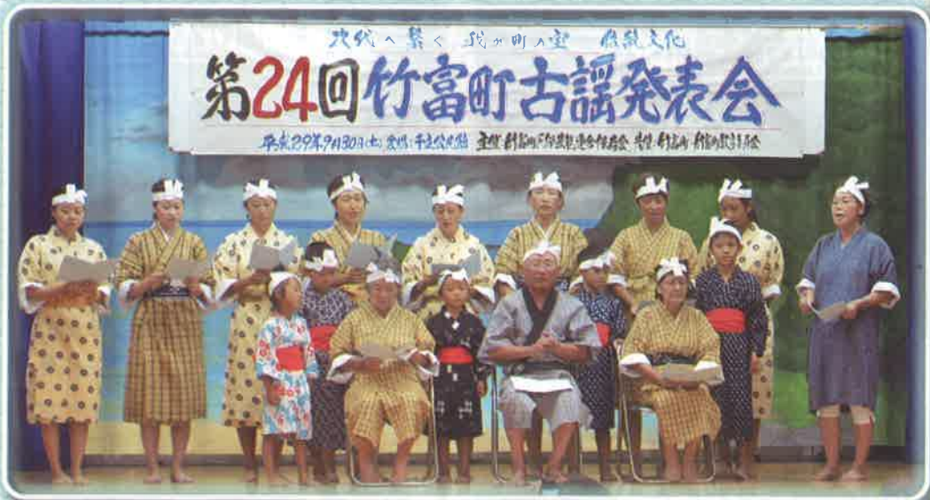
ゆば節 (古見民俗芸能保存会)