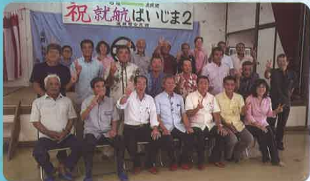
波照間公民館での祝賀会