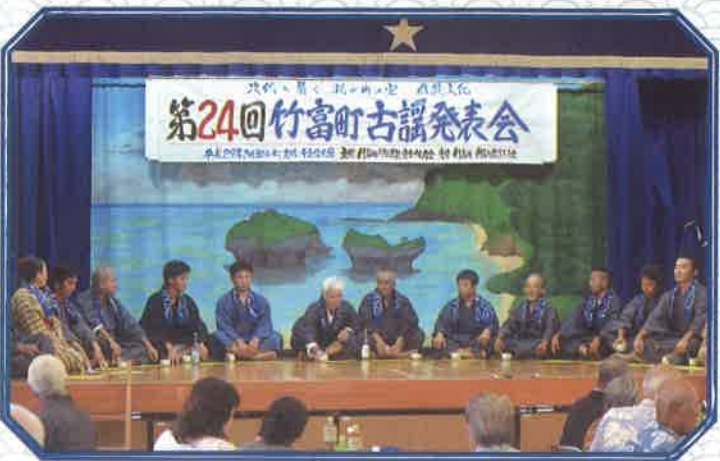
米神酒ぬアヨー／西表民俗芸能保存会