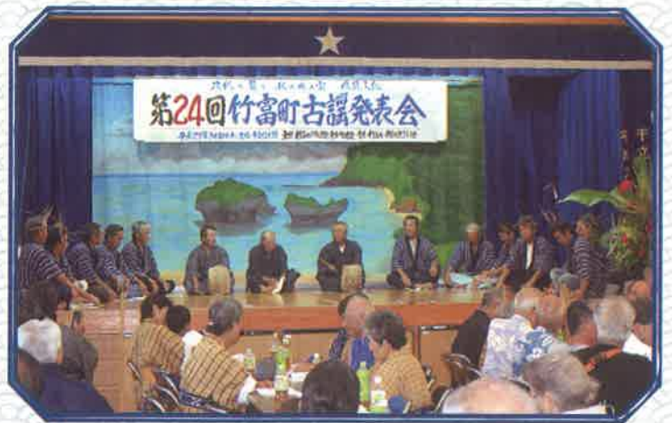
「節祭」きゆがびい、あとよいぬ唄／新城民俗芸能保存会