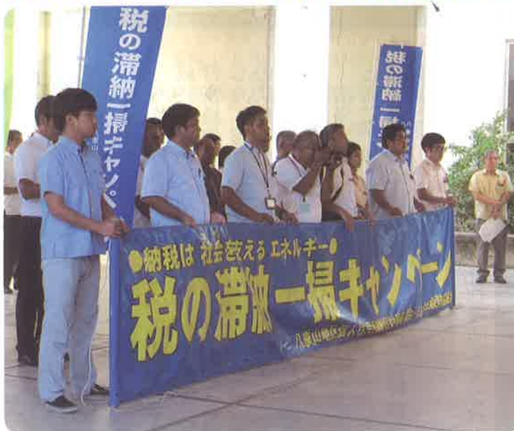
▲ 税の滞納一掃キャンペーン出発式

同キャンペーンは、全県では11月からの2ヶ月間となっていますが、八重山では平成20年度から国・県・3市町が独自に連携して取組んでおります。