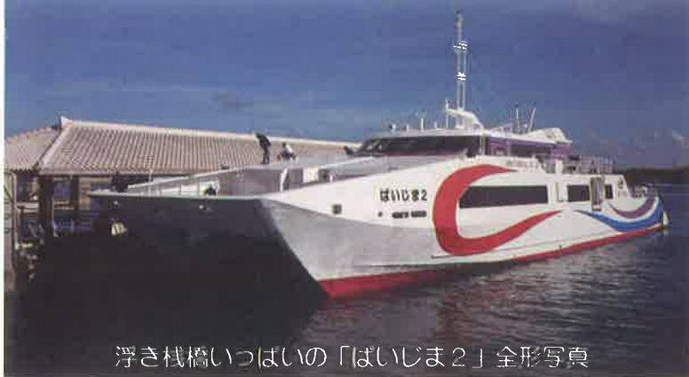
浮き桟橋いっぱい「ばいじま2」全形写真