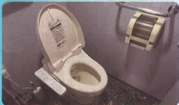
船内のウォッシュレット付きトイレ