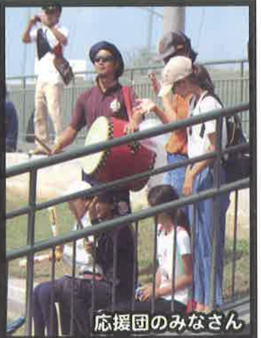
応援団のみなさん