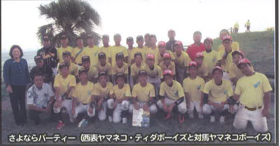
さよならパーティー（西表ヤマネコ・ティダボーイズと対馬ヤマネコボーイズ）