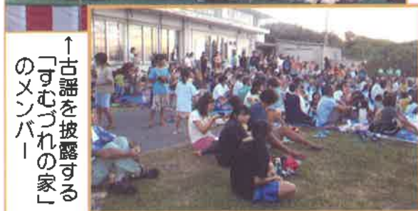
↑古謡を披露する「すむづれの家」のメンバー