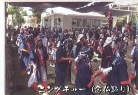
ソフチャー（念仏踊り）