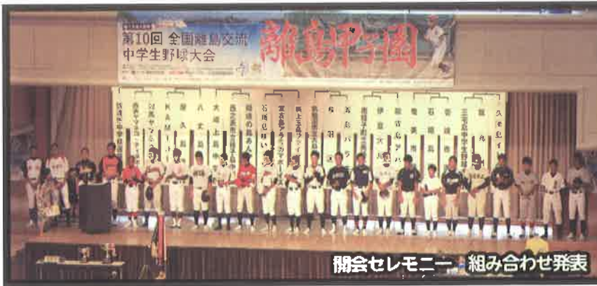
開会セレモニー 組み合わせ発表