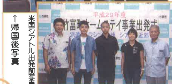
↑帰国後写真 米国シアトル出発前写真