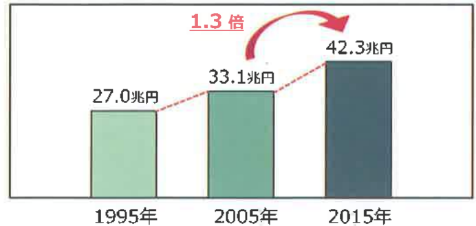
【国民医療費 10年ごとの推移】

国民皆保険を将来にわたって守り続けるため、平成30年4月から、これまでの市町村に加え、