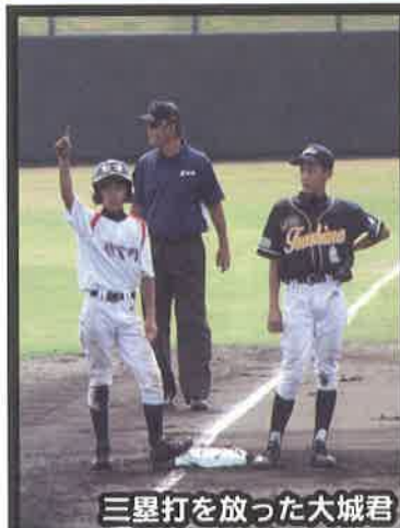
三塁打を放った大城君

選手達は、閉会式後もまさかり野球教室やさよならパーティーに参加し、各離島のメンバーと大いに交流を深めました。