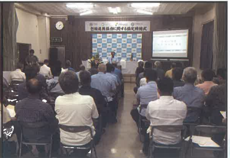
締結式会場の様子→