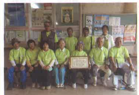
●祖納チーム（三位）祖納Aチーム