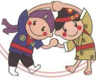
けんこうくん けんしんちゃん 沖縄県 国保マスコットキャラクター