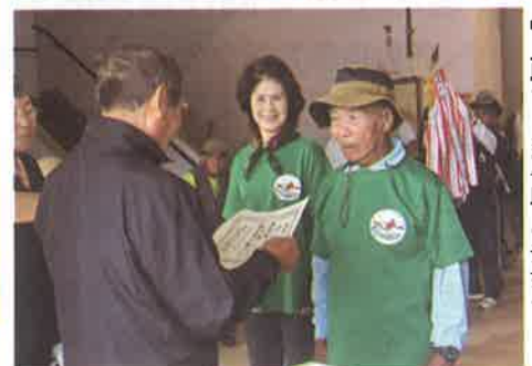
●上原チーム 準優勝 賞状授与