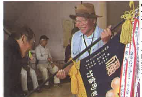
●干立Bチーム 優勝旗授与