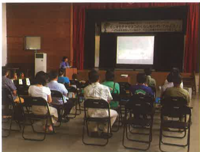
離島総合センター

去る6月24、25日に西表島東部の離島総合センターと西表島西部の中野わいわいホールにて「イリオモテヤマネコのくらしをのぞいてみよう」(主催：環境省西表島野生生物保護センター)と題し、講演会が行われた。講演会には、地域の方や親子連れも多数訪れ、各講師の話に耳を傾け、興味・関心を深めていた。