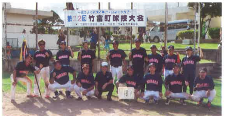
小浜公民館集合写真(ソフトボール優勝)