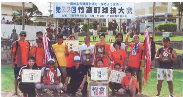
住吉公民館集合写真(総合優勝)