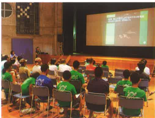
中野わいわいホール

去る6月24、25日に西表島東部の離島総合センターと西表島西部の中野わいわいホールにて「イリオモテヤマネコのくらしをのぞいてみよう」(主催：環境省西表島野生生物保護センター)と題し、講演会が行われた。講演会には、地域の方や親子連れも多数訪れ、各講師の話に耳を傾け、興味・関心を深めていた。