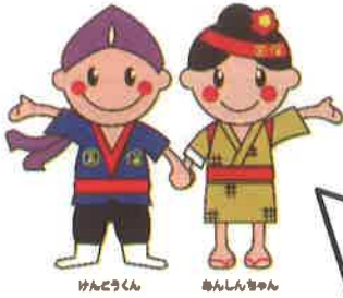
沖縄県国保マスコットキャラクター