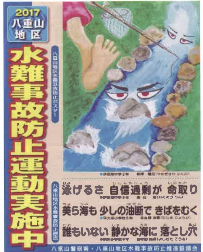
八重山地区水難事故防止ポスター