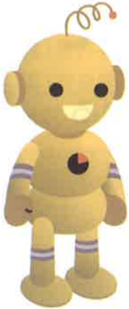
工業統計キャラクター コウちゃん