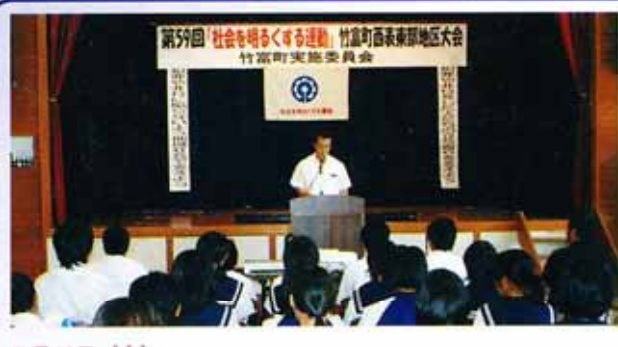
7月16日（木） 竹富町離島振興総合センターにて、第59回「社会を明るくする運動」西表東部地区大会が開催されました。